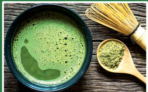
Eine Empfehlung von: Natalja Kerbs

Die Milch zum Tee hinzugeben. Für den Iced Matcha Latte dürfen Eiswürfel nicht fehlen. Wenn Sie mögen, zum Schluss mit ein wenig Matcha-Pulver dekorieren.